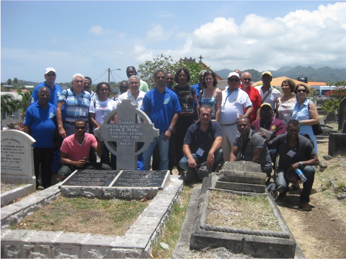
Les Rotariens du District 7030 sur la tombe de Walter Clément NOËL le vendredi 19 avril 2013

A deux mois de la Journée Internationale de la Drépanocytose (19 juin 2013) , les membres du Rotary Club de POINTE-A-PITRE-JARRY , profitant de leur participation à la 21 ème Conférence de District à la Grenade, ont tenu à se rendre sur la tombe de Walter Clément NOËL (11 juin 1884- 1 mai 1916) à Sauteurs. Ils étaient accompagnés de nombreux autres Rotariens des Clubs du District 7030. Une minute de silence a été observée.